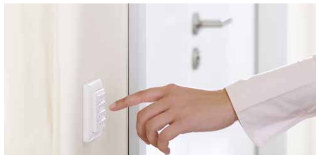
Sichere Zutrittskontrolle und einfache Bedienung: per Tastendruck.