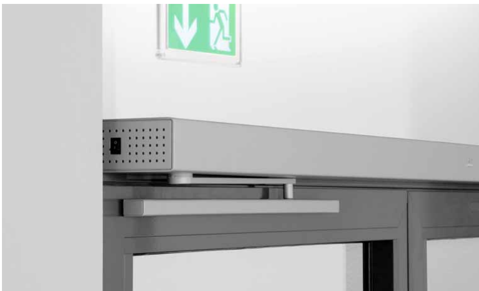
Professional: Nahtlose Verkleidung mit nur 70 mm Ansichtshöhe, für Profiltüren sehr gut geeignet.

Die mechanische Schließfolgeregelung ED ESR für zweiflügelige Türen arbeitet wartungsfrei und sorgt bei Türen mit Falz dafür, dass diese in der richtigen Reihenfolge schließen. Alle Komponenten des ED ESR sind unsichtbar unter der nur 70 mm hohen Abdeckung im DORMA Contur Design integriert.